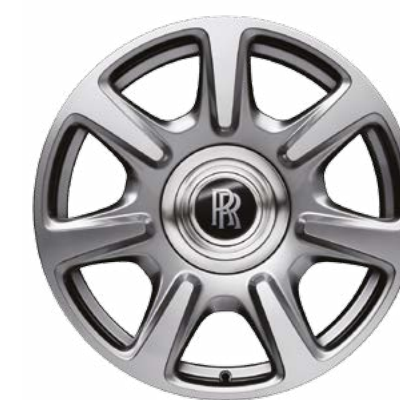
20 英寸样式 462 合金车轮 - 经过金刚石切削处理