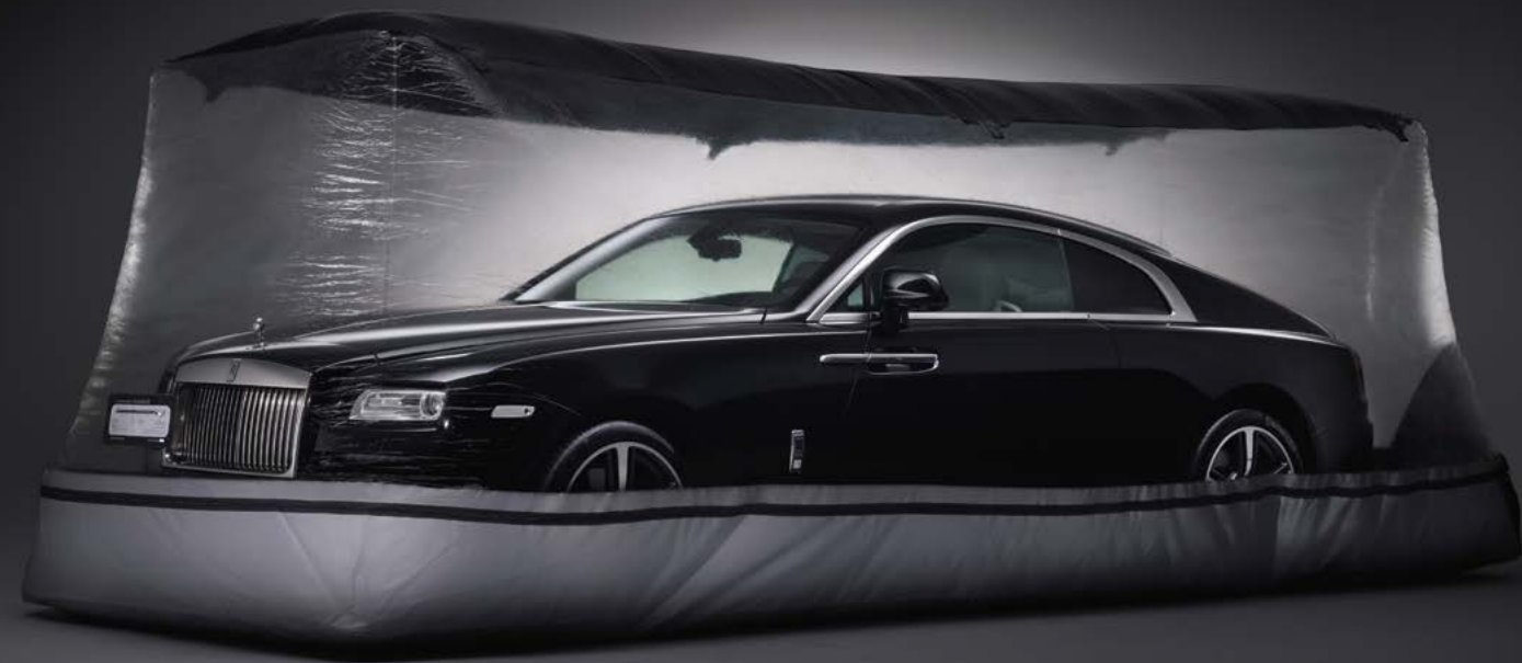
带通风系统的车衣