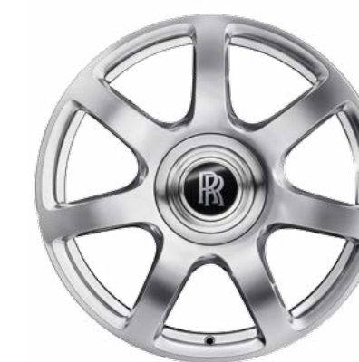
21 英寸式样 593 合金车轮 - 全抛光