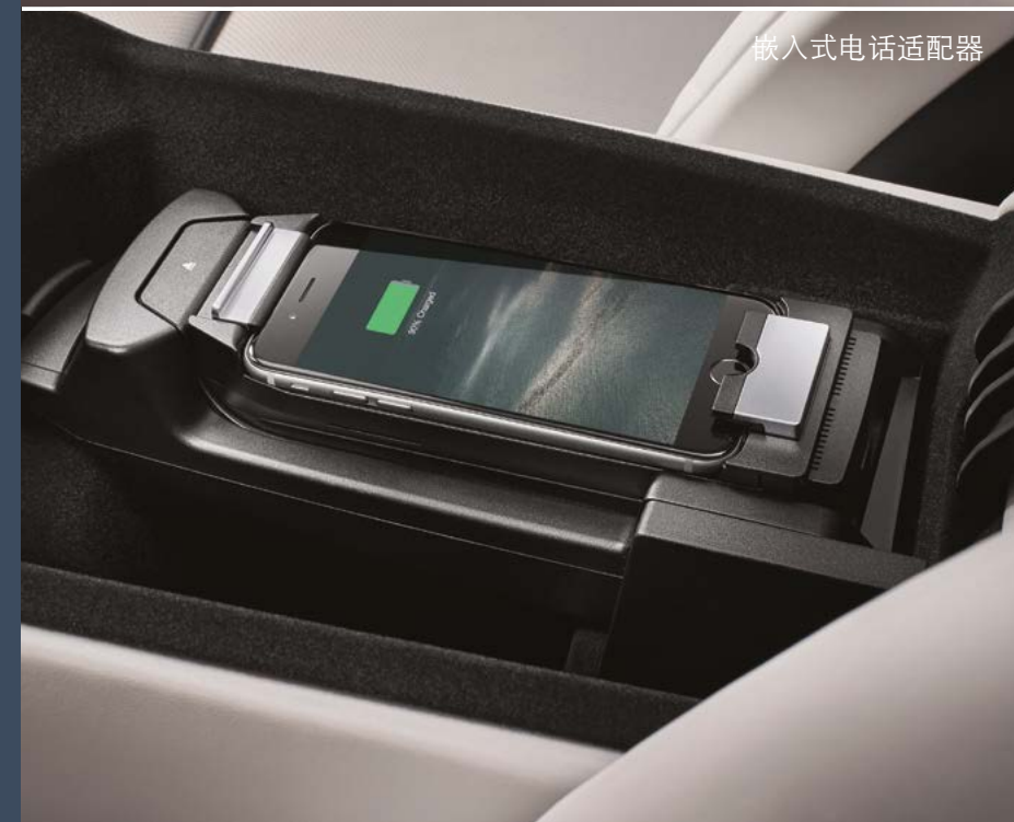
嵌入式电话适配器