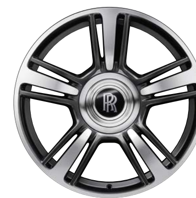
21 英寸式样 602 合金车轮 - 部分抛光