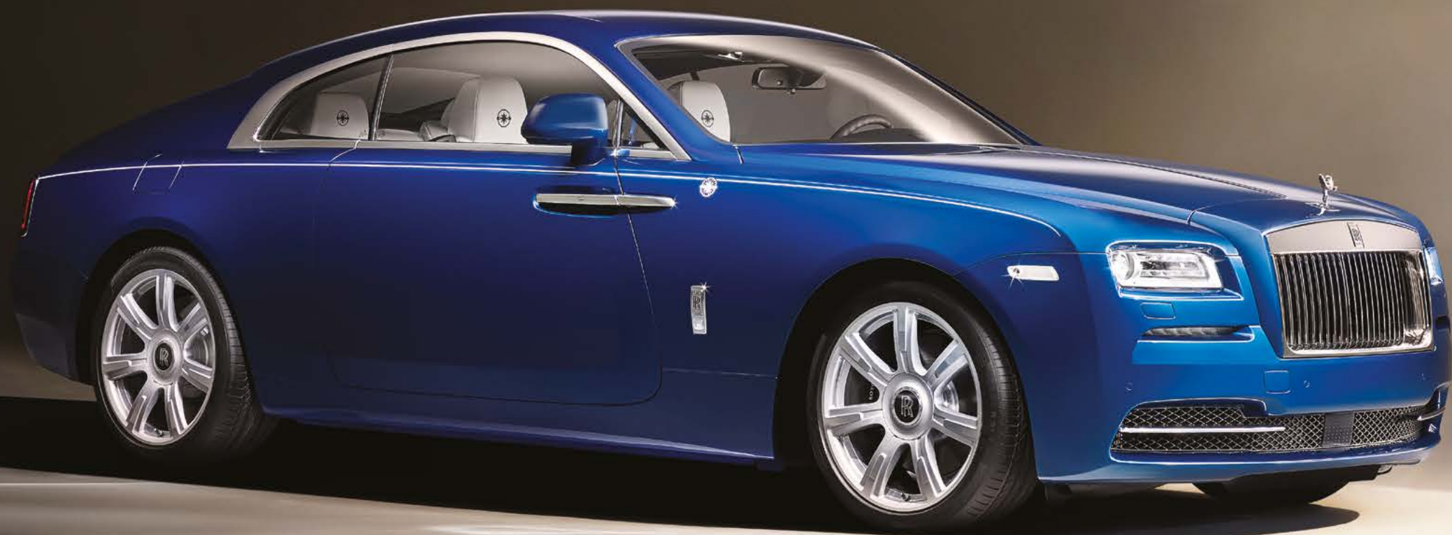
21 英寸式样 603 合金车轮 - 银色部分抛光